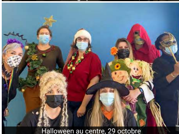
Halloween au centre, 29 octobre