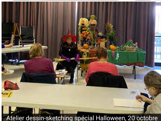
Atelier dessin-sketching spécial Halloween, 20 octobre