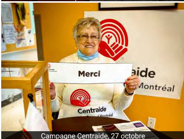
Campagne Centraide, 27 octobre