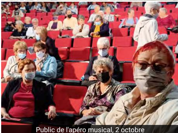
Public de l'apéro musical, 2 octobre