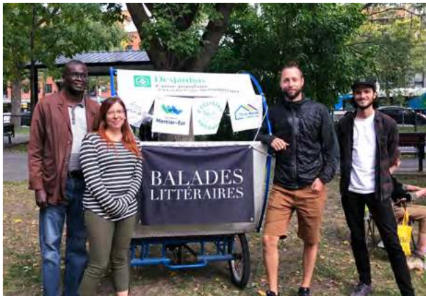
Dernière séance des balades littéraires, 23 septembre

Envoyez-nous vos photos d'activités pour les voir apparaître dans la prochaine programmation!