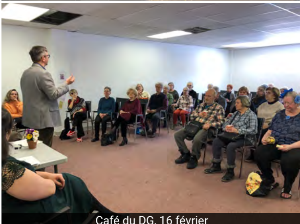
Café du DG, 16 février