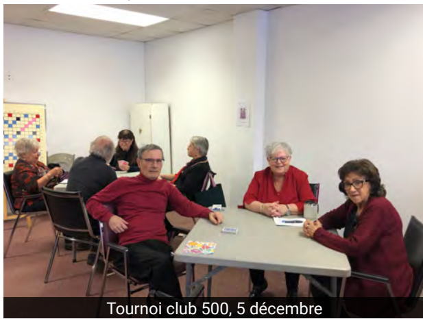
Tournoi club 500, 5 décembre

Envoyez-nous vos photos d'activités pour les voir apparaître dans la prochaine programmation !