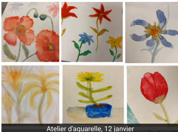
Atelier d'aquarelle, 12 janvier