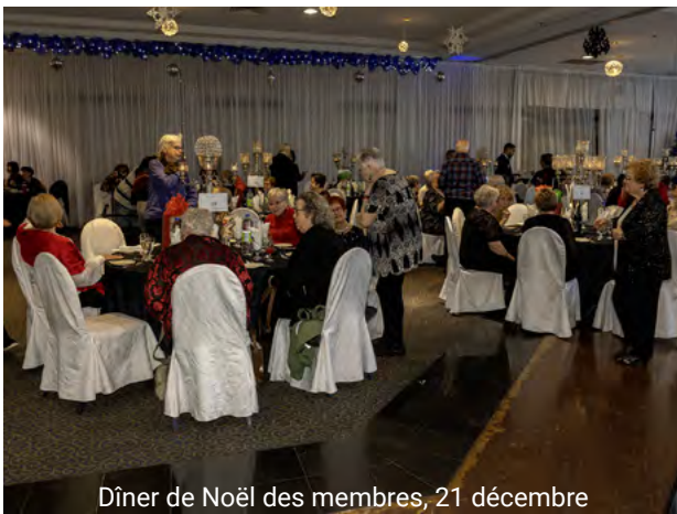
Dîner de Noël des membres, 21 décembre