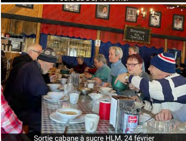
Sortie cabane à sucre HLM, 24 février