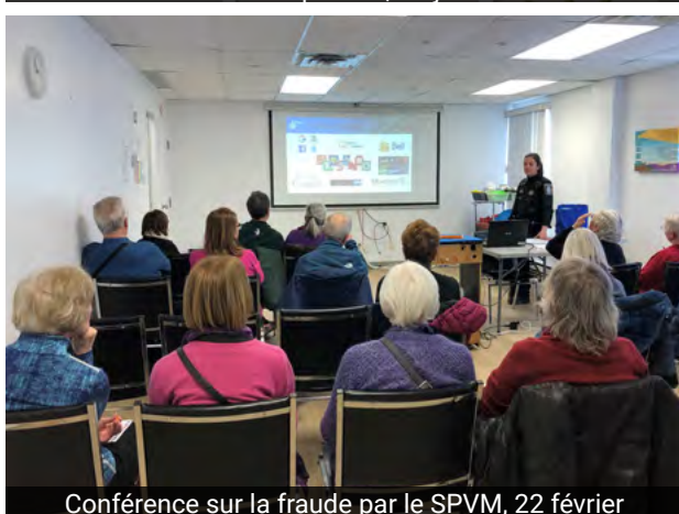
Conférence sur la fraude par le SPVM, 22 février